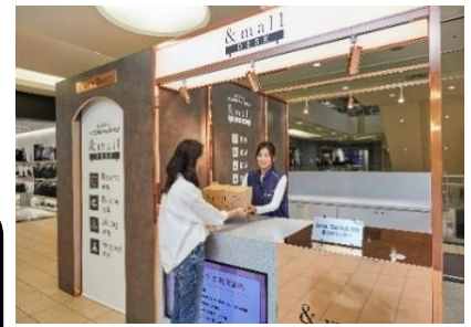
&mall 購入商品を送料無料で受け取り可能