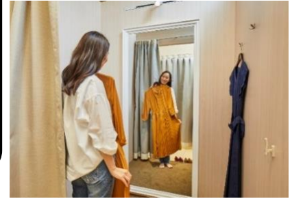
受け取った商品はその場で試着可能(返品無料)