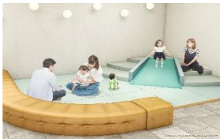
滑り台もあるラウンジ内キッズスペース

キッズスペースに隣接しているため、ご家族はお子さまを見守りながらお好きな飲み物を楽しんでいただけます。もちろん、お子さま向けのドリンクもご用意しております。