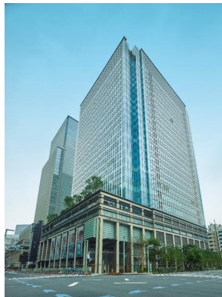
日本橋室町三井タワー