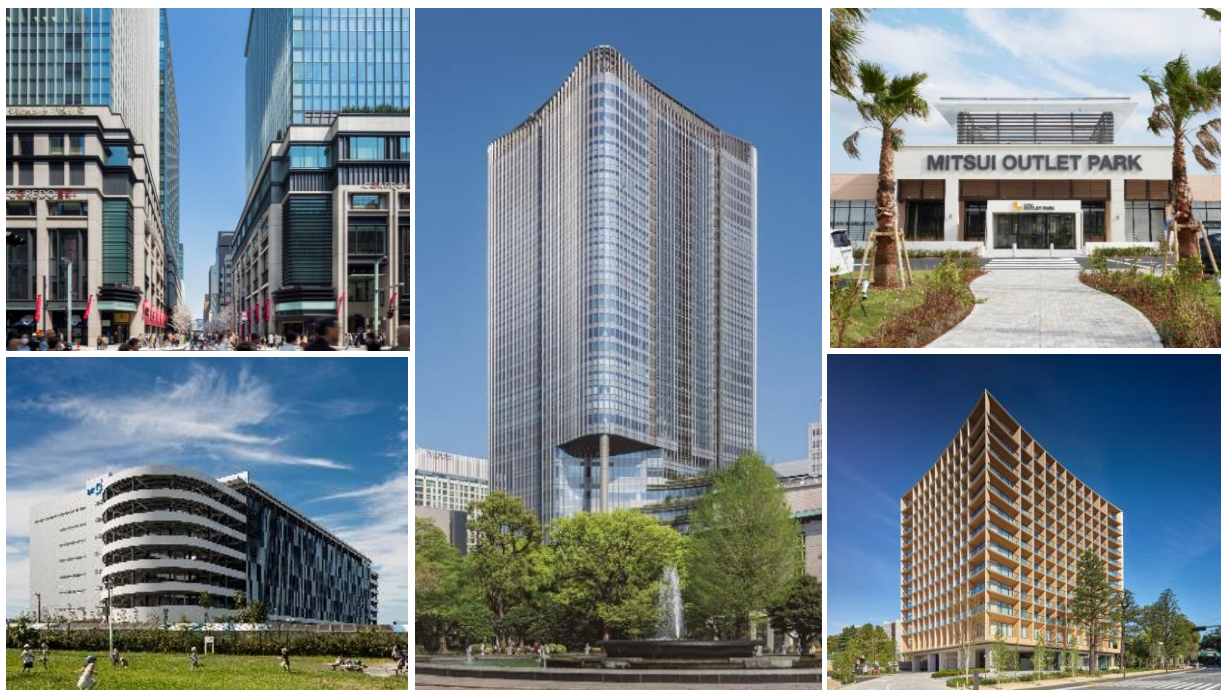
左上/COREDO 室町 1・2・3、左下/三井不動産ロジスティクスパーク船橋 I、中央/東京ミッドタウン日比谷、 右上/三井アウトレットパーク 木更津、右下/三井ガーデンホテル 神宮外苑の杜プレミア

※1:当社が使用する持ち分共用部相当電力(一部所有を含み、各施設内自家発電電力相当を除く)。「グリーン化」とは、非化石証書等を利用して使用電力を実質的に再生可能エネルギーとすること。