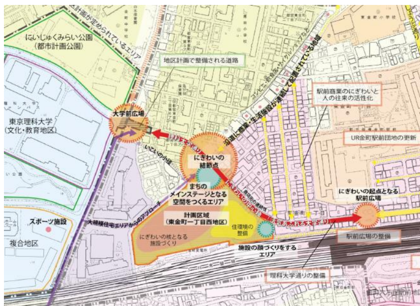
▲本プロジェクトの位置づけ