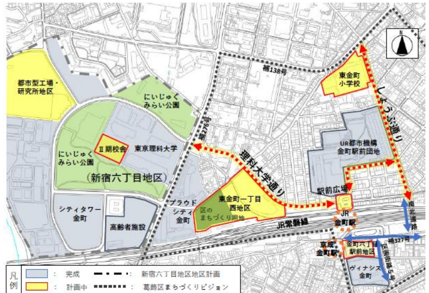
▲金町駅周辺におけるまちづくりの状況