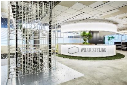
ワークスタイリング SHARE (ワークスタイリング六本木一丁目)

全国に広がる拠点を 10 分単位で利用可能な法人向け多拠点型サテライトオフィス「ワークスタイリング SHARE」、郊外エリアを中心とした法人向け個室特化型サテライトオフィス「ワークスタイリング SOLO」、多様化する企業のニーズや様々なビジネスシーンに合わせた法人向けフレキシブルサービスオフィス「ワークスタイリング FLEX」を展開しています。三井不動産グループが提供する国内全 38 か所の「ザ セレステインホテルズ」「三井ガーデンホテルズ」「sequence」提携拠点と併せて、2021 年 5 月 20 日時点で 130 拠点を展開しています。