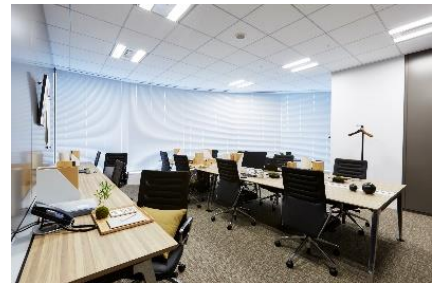
ワークスタイリング FLEX (ワークスタイリング東京ミッドタウン日比谷)

※ ワークスタイリング公式ホームページ: https://mf.workstyling.jp/