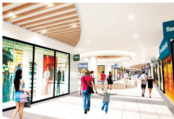
MOP 台湾林口第2期 2F 内観 イメージ

現在当社は、開発中の物件も含め、台湾で計5施設の商業施設(「三井アウトレットパーク」事業3施設、「三井ショッピングパーク ららぽーと」事業2施設)を推進しております。アジア全体では、今年4月に開業を迎えた「三井ショッピングパーク ららぽーと上海金橋」や、2021年中に開業予定の「(仮称)三井ショッピングパーク ららぽーとクアラルンプール」や「三井ショッピングパーク ららステーション上海蓮花路」を合わせ計9施設の展開となります。