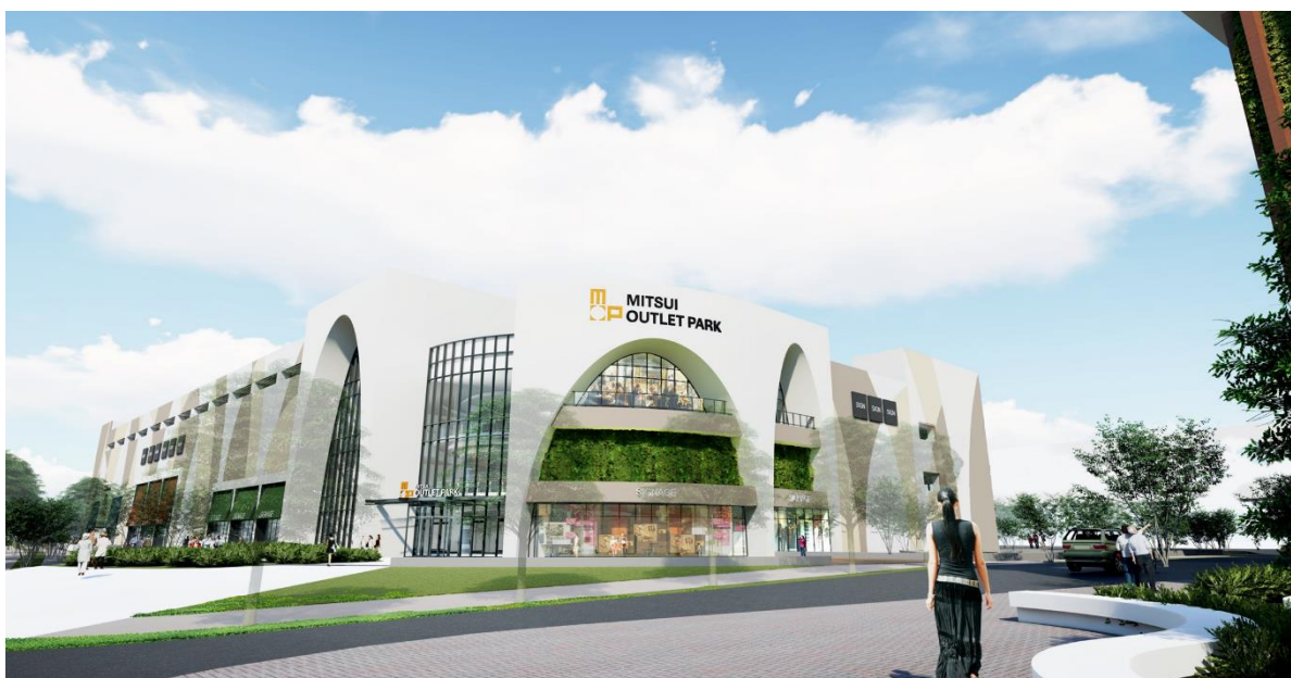
MOP 台湾林口第2期 外観 イメージ

また、MOP 台湾林口第2期着工を皮切りに、他事業者も含めた台湾北部有数の集客エリア「林口国際メディアパーク」の開発が始動します。