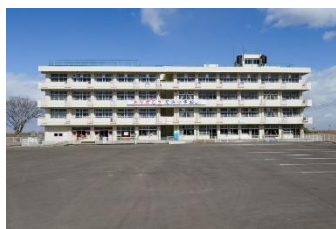
震災遺構 仙台市立荒浜小学校