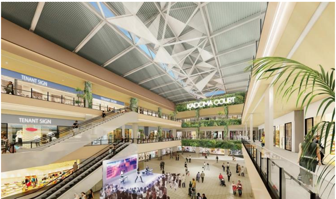
センターコートイメージ

屋外広場の設置、エレベーター非接触ボタン等の非接触型システムの導入など、新しい生活様式に対応した施設計画を積極的に進めます。