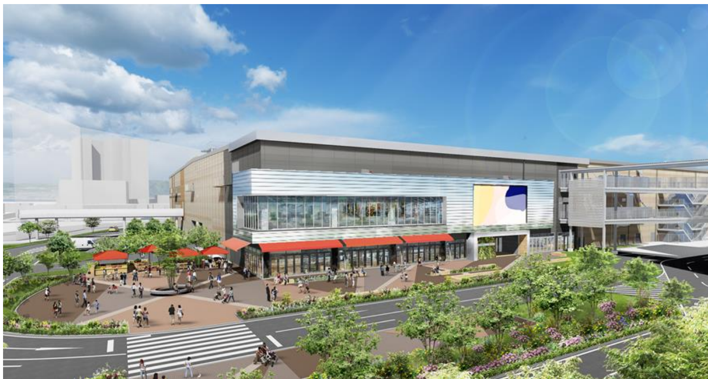
「(仮称)門真市松生町商業施設計画」建物全体イメージ

三井不動産と三井不動産レジデンシャルは、各事業者と相互に連携を図りながら、多様な人々が集い出会うコミュニティの拠点となる魅力あふれる空間を創出し活気ある街づくりに貢献するとともに、社会課題を解決することで、持続可能な社会の実現に向けて取り組んでまいります。