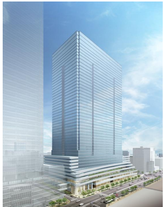
外観イメージパース(東京駅八重洲口側)

今後も、国際都市・東京の中核となる東京駅前における都市再生ならびにSDGsに貢献する100年後を見据えたサステナブルな街づくりの実現に向け、本事業を推進してまいります。