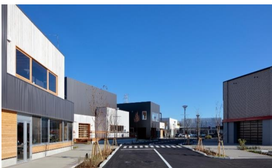
KOIL 16 Ichiroku Gate by Mitsuifudosan

・会員制のDIYファクトリー「KOIL FACTORY PRO」やガレージ連携ミニオフィスなど、 ものづくりに取り組む企業向けのオフィス空間も併設。 住民や来街者、起業家などの交流を促し、柏の葉スマートシティならではのコミュニティづくりも目指します。