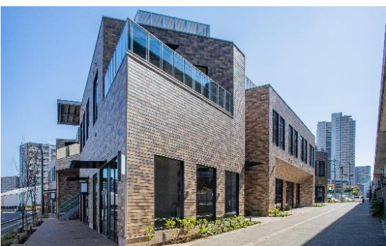
KOIL LINK GARAGE by Mitsuifudosan