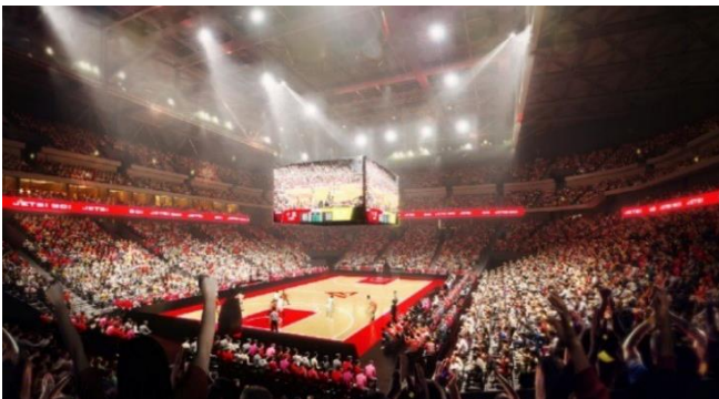
バスケットボール試合開催時 CG