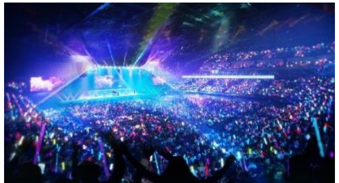
音楽コンサート開催時 CG