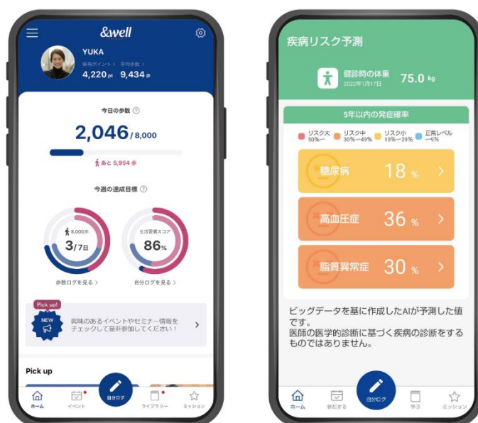
「&well」アプリ画面イメージ