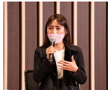
「女性のエンパワメントと多様性を考える」トークディスカッション