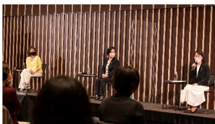
「女性のエンパワメントと多様性を考える」 トークディスカッション

毎年3月の国際女性デーに合わせて著名な講師をお招きし、「女性のキャリア&ダイバーシティ」に関するセミナーを開催しています。働く女性が直面する課題について考える機会や、相談の場を提供することで、多様な働き方の実現をサポートします。なお、本セミナーは昨年よりコロナ禍のため、オンデマンドで開催しています。