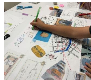
「日本橋探求キット」

Work-Life Bridge の活動の詳細については、こちらをご参照ください。