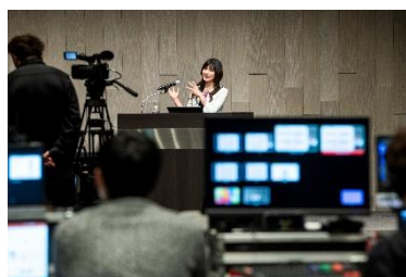
「コロナに負けない。生産性の高い働き方とは」 オンデマンドセミナー