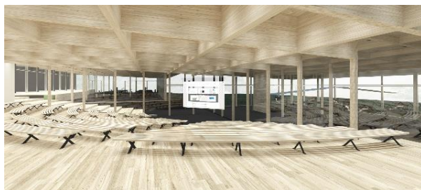
新築校舎内装イメージ1