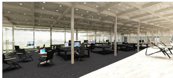
新築校舎内装イメージ2