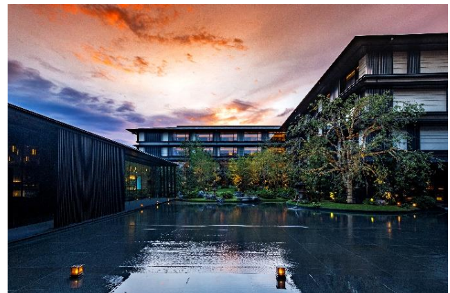
HOTEL THE MITSUI KYOTO(2020年11月開業)