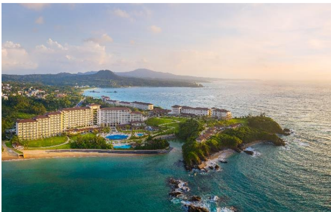
ハレクラニ沖縄(2019年7月開業)