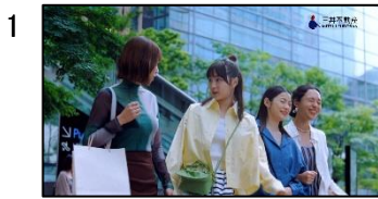
1 (広瀬さん) 東京ミッドタウンはね、