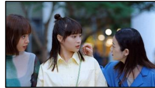
10 (友人B) すずちゃんやな