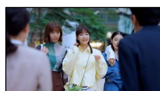
13 (ビジネスマン男性) あなたが