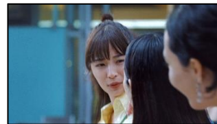
11 (広瀬さん) なにそれ～