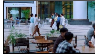
9 (友人B) こりゃ三井の