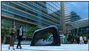
5 (広瀬さん) それを手掛けているのが