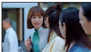
8 (友人A) 詳しくでしょ