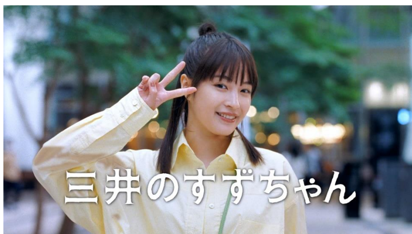
新デジタル広告「三井のすずちゃん」篇より

本作品を皮切りに、“三井のすずちゃん”こと広瀬さんが、当社のさまざまな街づくりや施設、不動産業を超えた新しい取り組みを紹介していく連続ドラマ仕立てのシリーズ CM に乞うご期待ください。