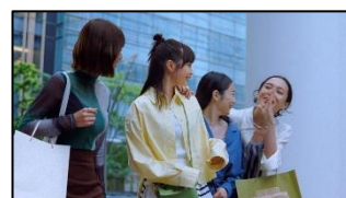
12 (友人C) 三井のすずちゃん！ (友人A・B) よっ！ (広瀬さん) ちょっとやめてよ～