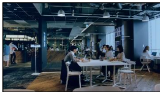
4 (広瀬さん) ひとつの街なの