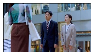
14 (ビジネスマン男性) 伝説の三井の すずちゃんですね