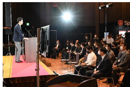
展示会会場内 ステージの様子