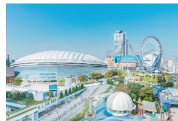
【例】会員限定 特典付き東京ドーム見学ツアー

三井不動産グループの各種施設・サービスを活用し、すまいに関連したサービスはもちろんのこと、くらしの豊かさ向上に貢献する幅広く多彩なサービスを提供します。