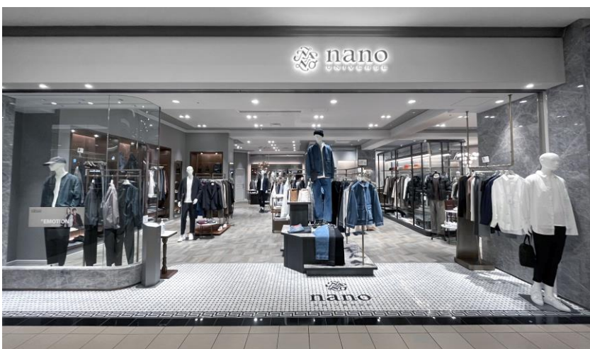
nano・universe ららぽーと TOKYO-BAY 店

*一般社団法人 日本ショッピングセンター協会 第一種正会員(デベロッパー)を対象に、当社が独自に調査(2022年10月14日時点)