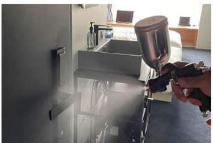
客室内の消毒と抗菌対策の徹底