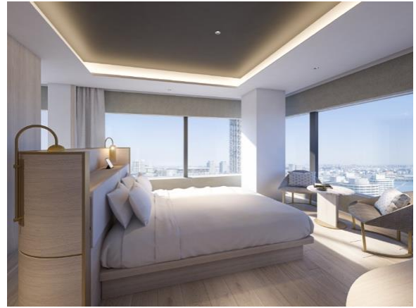
エクゼクティブコーナーツイン