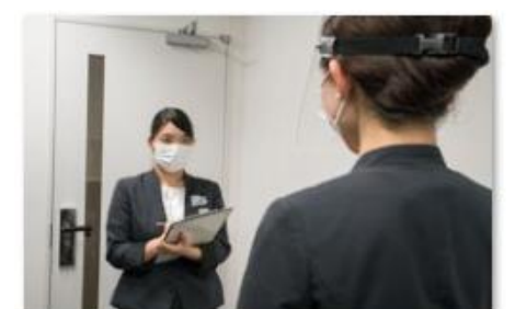
スタッフの体調管理の徹底