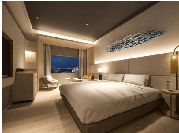
デラックスキング

全室が21階以上の高層階となっており、開放的な眺望でみなとみらいの夜景を眺められます。また、広々とした27㎡、33㎡の面積を有する客室タイプを中心としています。ワイド1820mmのキングサイズのベッドを設置した客室(62室)や、天気の良い日に富士山が見える客室(168室)、大きな窓に囲まれるコーナールーム(28室)、連泊で滞在されるお客さまからのニーズが高い電子レンジ・洗濯機付きの客室(20室)、女子旅・ファミリー層もゆったりと寛げる常設トリプル部屋(30室)、プロジェクター付きのシアタールーム(14室)など、豊富なラインナップからお好みの客室をお選びいただくことができます。