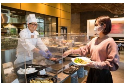
レストラン店内のアクリルボード設置とマスク・手袋着用徹底(ビュッフェ)