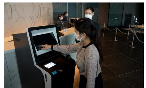
自動チェックイン機導入による接触軽減