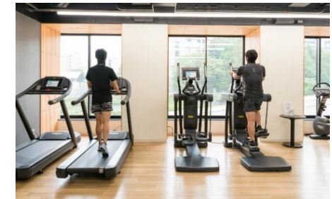
フィットネスなどパブリックスペースの人数制限と消毒の徹底