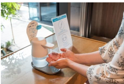
入館、館内施設利用時の検温と消毒