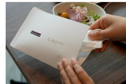
レストラン店内ではマスクケースをご用意