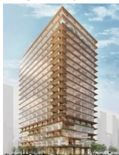
木造賃貸オフィス CG パース

なお、伐採適期を迎えて計画的に伐採した木材、森のメンテナンスのために間伐した木材は、木造賃貸ビルや木造住宅などの主要部材、各施設の仕上材のほか、住宅のフローリング材の下地やオフィス家具、商業施設共用スペースのベンチや遊具で使うなど、グループ企業で幅広く、積極的に活用しています。