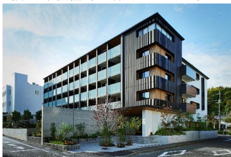
木造マンション「MOCXION(モクシオン)」

※当パースは現時点でのイメージであり、今後変更になる可能性があります