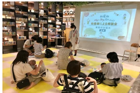
ベビーケアステーションの様子