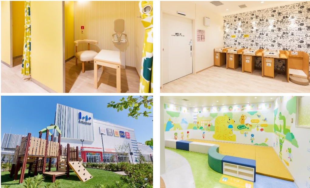
赤ちゃん休憩室・キッズスペース・授乳室・おむつ台の設置事例 (上段:ららぽーと福岡(福岡県)、下段:ららぽーと堺(大阪府))

ららぽーとでは、子育て世代に快適に安心してお買物を楽しんでいただけるよう、授乳室、おむつ台、キッズスペース、フードコート内の小あがり席、屋内外の広場空間といった設備を充実させています。