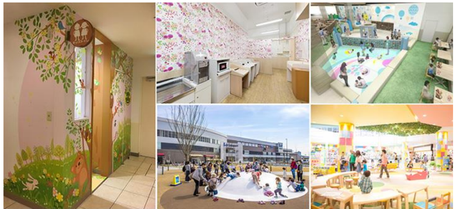
各ららぽーとにおける、子育て世代にうれしい機能・設備例 (おもちゃ台・キッズトイレ・キッズスペース等)

ららぽーとでは、お子さまがお腹にいるときも、大きくなってからも、パパ・ママが楽しく安心して過ごすことができるように、“もっとパパ・ママに優しいららぽーとへ。”をスローガンとして、『ママ withららぽーと』の取り組みを進めています。三井不動産のママ社員が「子育てママ」の視点で開発に携わった「ららぽーと和泉(大阪府)」の開業(2014年10月)を機に、現在では全国18施設のららぽーとで『ママ withららぽーと』の理念を掲げています。ベビー休憩室やお子さまが遊べるスペース等の設備面はもちろん、パパ友・ママ友と交流できるイベントや親子で楽しめるワークショップ等の取り組みも積極的に実施しています。お子さまやパパ・ママをはじめ、子育てに関わるお客さまへ体験価値を提供できる場として、三井不動産は今後もパパ・ママの声に耳を傾け、居心地の良い施設づくりを目指してまいります。