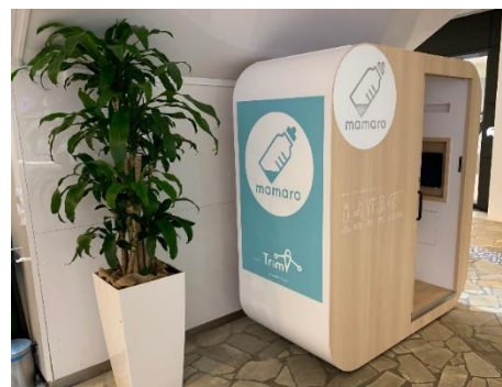
左・中央:「mamaro™」使用イメージ、右:「mamaro™」設置事例(ららぽーと横浜)