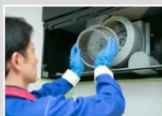
ハウスクリーニング