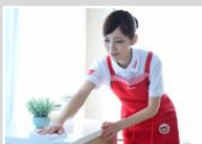
家事代行サービス