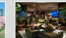
リフォーム(マンション・戸建)