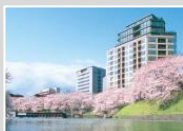
新築分譲マンション・戸建購入