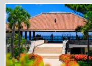
はいむるぶし ホテルクレジット