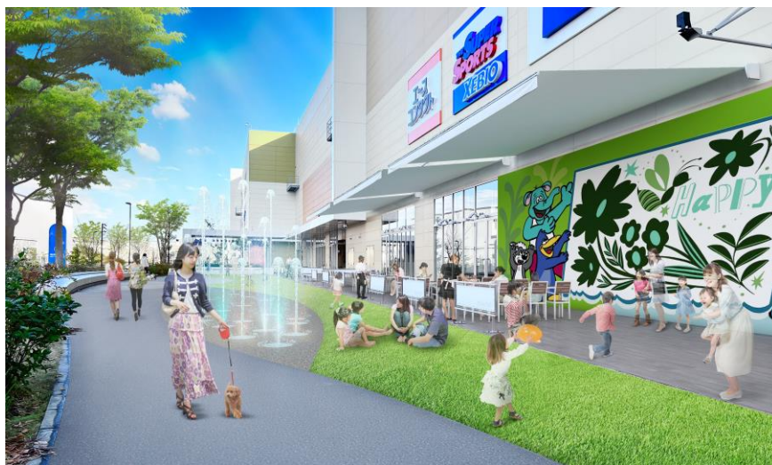
屋外広場「空の広場」CG

子どもから大人まで楽しめる屋外広場「空の広場」では、従来から設置されているポップジェット周辺に、新たに人工芝を敷設しました。子どもたちが安心して楽しく遊ぶことができる明るい遊び場へと進みます。「空の広場」横のテラス席と合わせ、ファミリーやペット連れのお客さまも開放的な空間で食事をお楽しみいただけます。