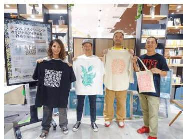
シルクスクリーン体験ワークショップの様子(2022年9月実施)