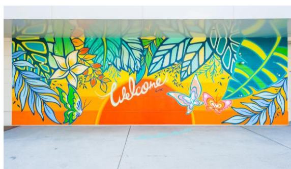
人が入って遊べる壁画(2018年実施)