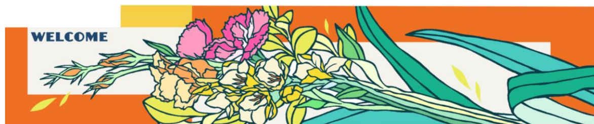
南エントランス 壁面アート