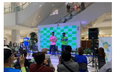
「湘南ベルマーレ選手トークショー」の様子 (2022 年 10 月実施)

今後もららぽーと湘南平塚は、日々サッカーキッズやファン・サポーターの皆さま、地元の方々が「湘南ベルマーレ」選手と会える場・応援できる場をさまざまな形で創出してまいります。