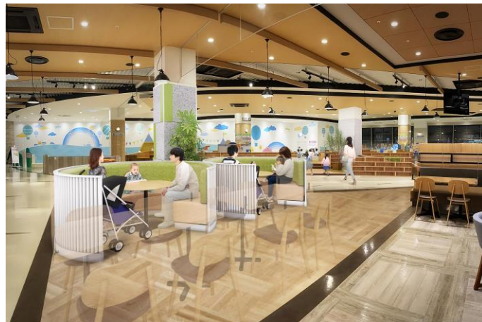
フードコート内 ファミリーエリア CG