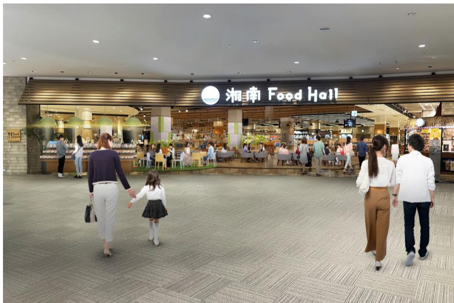
フードコート「湘南 Food Hall」 CG

本リニューアルでは、約 20 店舗が 3 月 17 日(金)より順次オープンします。お客さまの多岐にわたるニーズに応えるべく店舗ラインナップを拡充するほか、フードコート「湘南 Food Hall」や屋外広場「空の広場」を大幅改修し、開業時からのテーマである「集い」「繋がり」を通じて、お客さまが思い思いの時間をより楽しく過ごしていただける施設へと進化します。