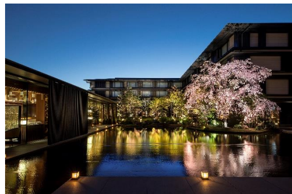
HOTEL THE MITSUI KYOTO(2020年11月開業)