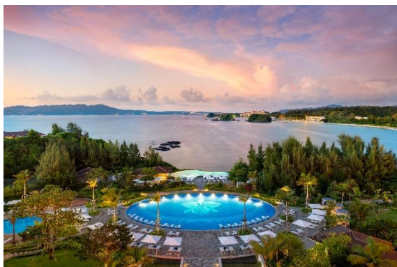
ハレクラニ沖縄(2019年7月開業)