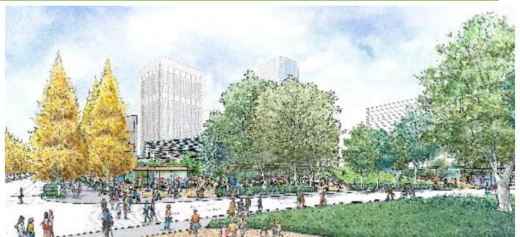
中央広場整備イメージパース