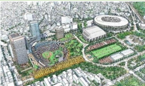
東側から計画地を望むイメージパース