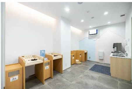
おむつ替えスペース