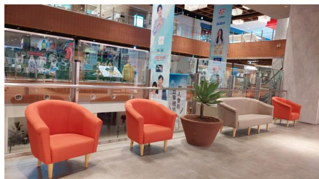
館内休憩スペース