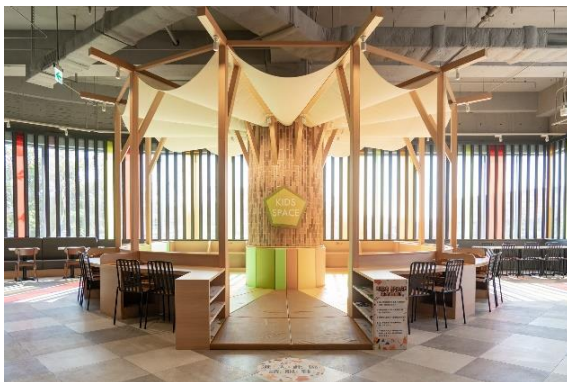
フードコート内キッズスペース(南館)

靴を脱いで遊ぶことができる約50㎡のキッズスペースには、0～2歳向けの「グリーン」エリア、3～6歳向けの「オレンジ」エリアと対象年齢を分けたゾーンを設けました。お食事前後にお子さまが遊べる場所があり、ファミリーでお越しのお客さまがより一層利用しやすいフードコートです。また、キッズスペースを囲むテーブルには、お子さま専用の固定椅子を設置しており、安心してお子さまとゆっくり食事をお楽しみいただけます。