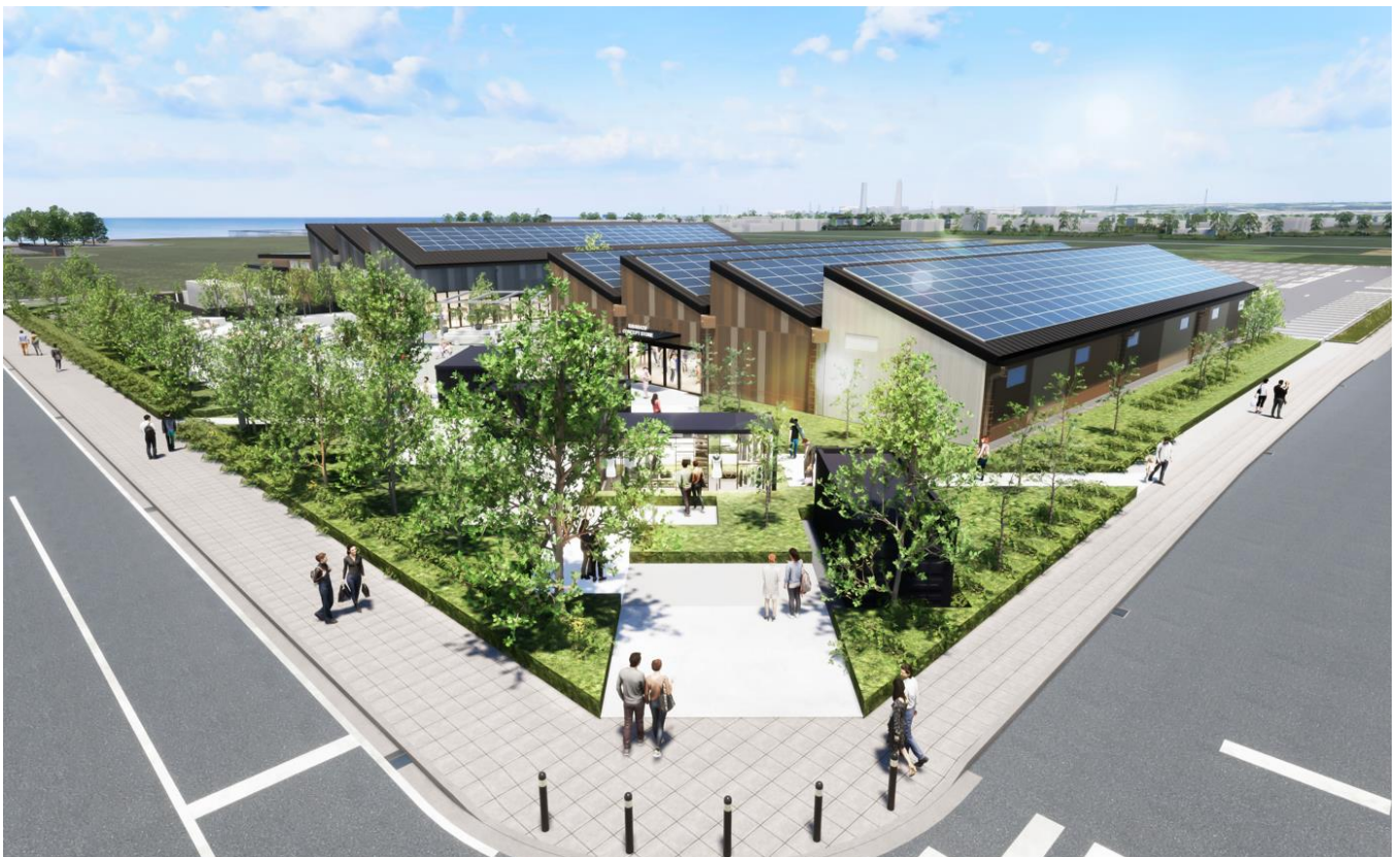
「KISARAZU CONCEPT STORE」 外観 イメージ