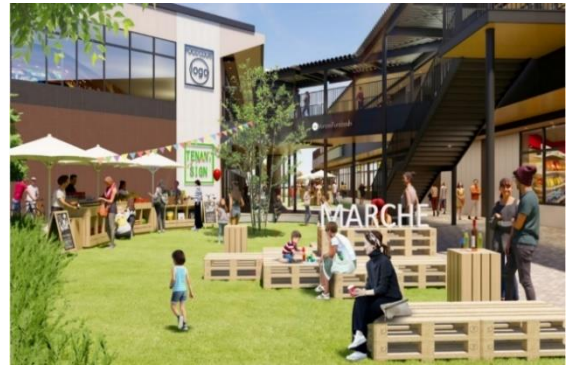
広場スペース イメージ