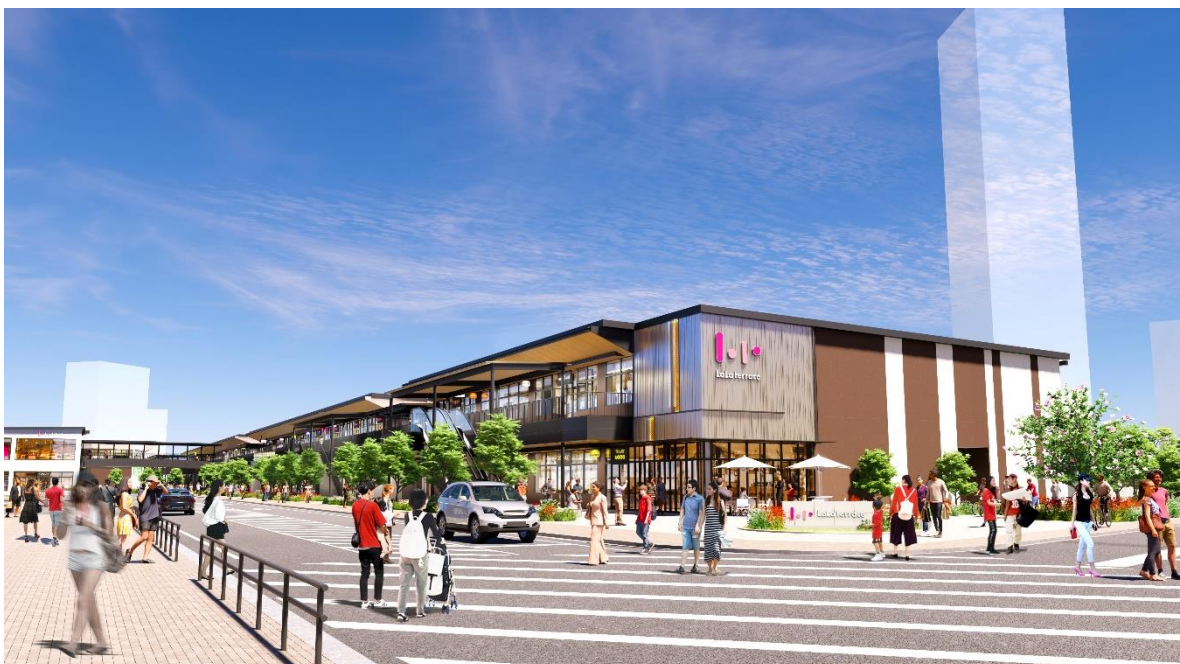
「三井ショッピングパーク ららテラス TOKYO-BAY」 外観 イメージ

地域居住者の日常の憩いの場となる約5,000㎡もの大規模な広場空間と、デイリーニーズに応じた全36店舗を揃え、コミュニティの拠点として魅力あふれる商業環境を創出し、活気ある街づくりに貢献いたします。また、効率的なエネルギー運転管理等によるCO2排出量の削減など、持続可能な社会の実現にも取り組みます。