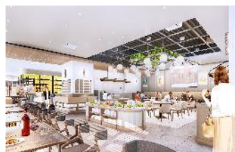
Cafe & Restaurant CENTRALE 内観 CG