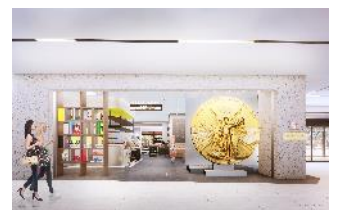
メインエントランス CG(展示エリア側)

※GAP 認証食材とは: 食品安全、環境保全、労働安全、人権と福祉に配慮した農場管理を行う農場に与えられる認証制度です。