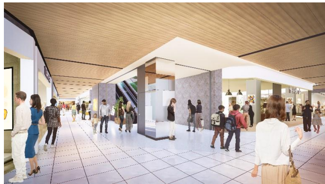
「ららテラス HARUMI FLAG」内観 イメージ

スーパーマーケットを核として、生活利便性の高い物販店舗やサービス店舗を提供するほか、晴海エリア最大規模の「食」のフロアを展開