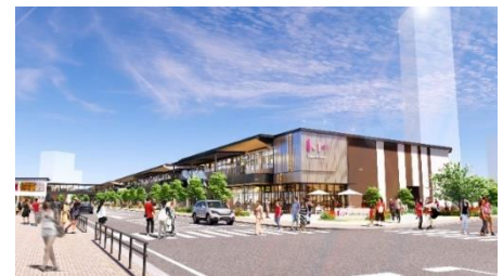
「ららテラス TOKYO-BAY」外観イメージ

JR 南船橋駅前開発を推進してきた本施設は、「&MORE 暮らしにもっと便利さを、毎日にもっとおいしいを。」のコンセプトのもと、帰りがけについで足を運びたい生活利便性の高い店舗を中心に全 36 店舗が出店するほか、ドッグランや遊具広場を備えるだけでなく、フードフェスやスポーツのパブリックビューイングなど様々なイベントの実施を予定している約 5,000 ㎡の大規模広場も整備し、憩いとくつろぎの場を提供します。