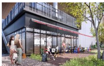
外観 CG(Cafe & Restaurant CENTRALE 側)