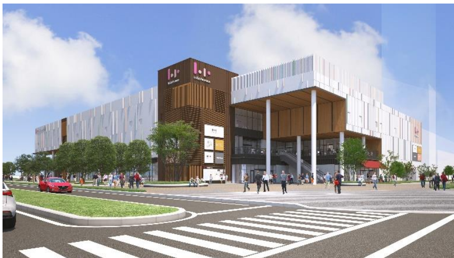
「ららテラス HARUMI FLAG」外観 イメージ

また、同じライフスタイル型商業施設「三井ショッピングパーク ららテラス TOKYO-BAY」(千葉県船橋市)が 2023 年 11 月 29 日(水)にグランドオープンすることが決定しました。本日プレスリリースを発表しておりますので、あわせてご覧ください。