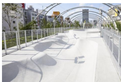
MIYASHITA PARK (東京都渋谷区)

2024年春には収容人数1万人規模の大型多目的アリーナ施設「(仮称)LaLa arena TOKYO-BAY」(株式会社MIXIとの共同事業)の開業も控えており、今後も「スポーツの力」を活用した街づくりを推進してまいります。