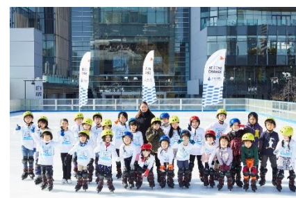
三井不動産スポーツアカデミー (アイススケートアカデミー)