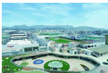
三井ショッピングパーク ららぽーと福岡 (福岡県福岡市)