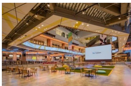
三井ショッピングパーク ららぽーと堺