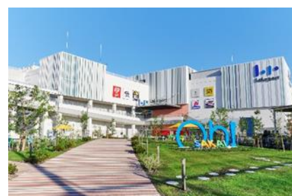
三井ショッピングパーク ららぽーと堺 (大阪府堺市)