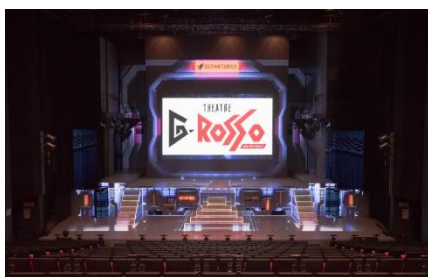
東京ドームシティ シアターG ロッソ