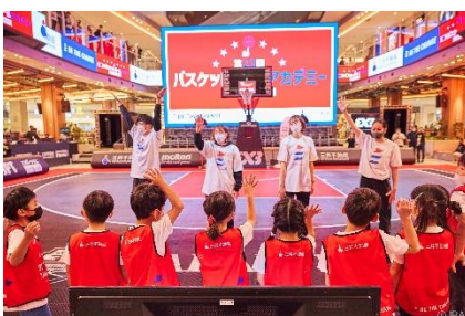
三井不動産スポーツアカデミー (バスケットボールアカデミー)