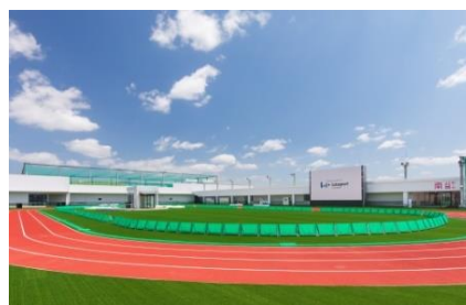
三井ショッピングパーク ららぽーと福岡