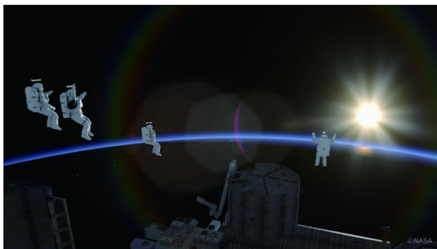
宇宙の日の出(メタバース体験画像)