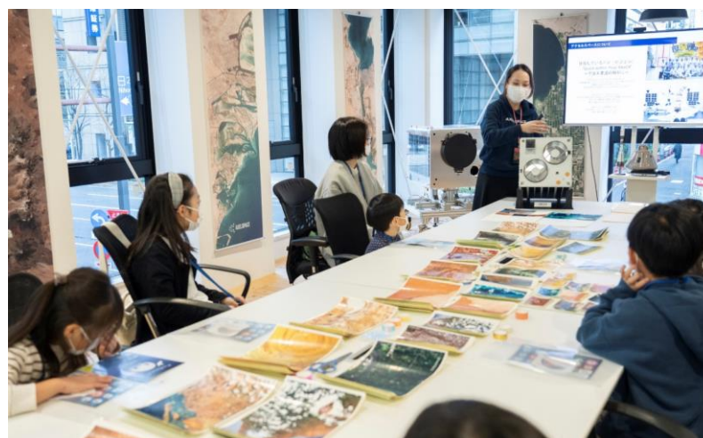
あつまれキッズ！宇宙の仕事ワークショップ（イメージ画像）