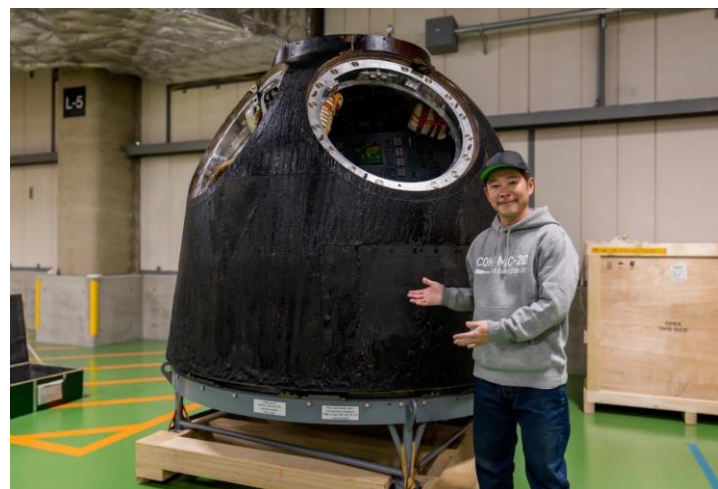
宇宙船「ソユーズ」の帰還モジュール