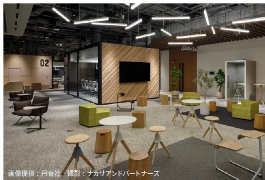
4階 テンポラリーオフィス