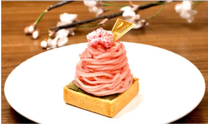
IL BACARO ALMA 「桜と抹茶のモンブラン」

日本橋エリアの約200店舗が“桜”をテーマにした、この春限定のメニューを展開します。こころも満たすスイーツから、お弁当、軽食、グッズまで、見て楽しい、味わっても楽しい春の品々が揃いました。