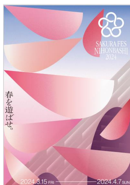
SAKURA FES NIHONBASHI 2024 キービジュアル

協力：日本橋地域ルネッサンス100年計画委員会、名橋「日本橋」保存会、日本橋料理飲食業組合、久松料理飲食業組合、人形町商店街協同組合、甘酒横丁商店街、浜町商店街連合会、東日本橋やげん堀商店会、日本橋北詰商店会、日本橋三四四会、日本橋一之部連合町会(順不同)