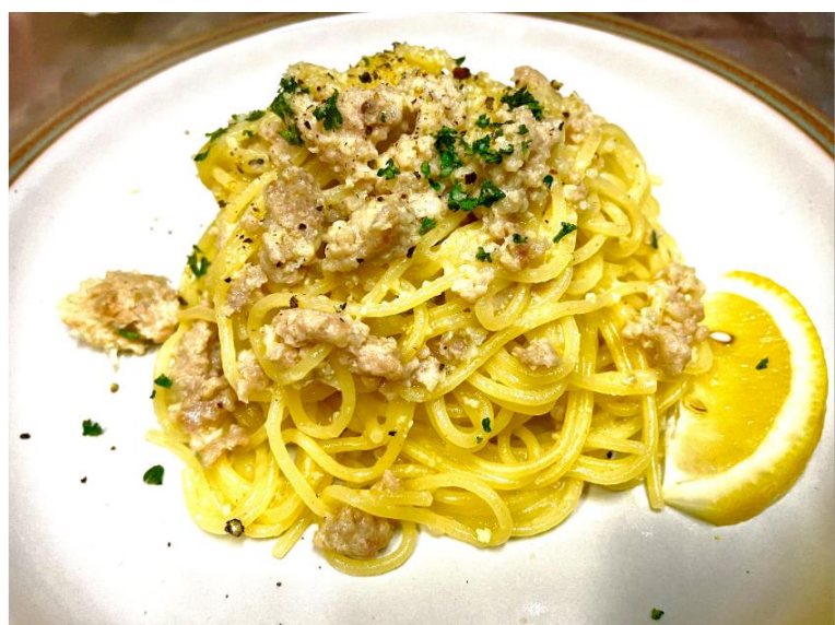
「ナンコツ入り鶏ミンチの スパゲッティパクチーのせ」