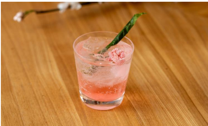
室町 美はま 「桜薫るクラフトサワー」