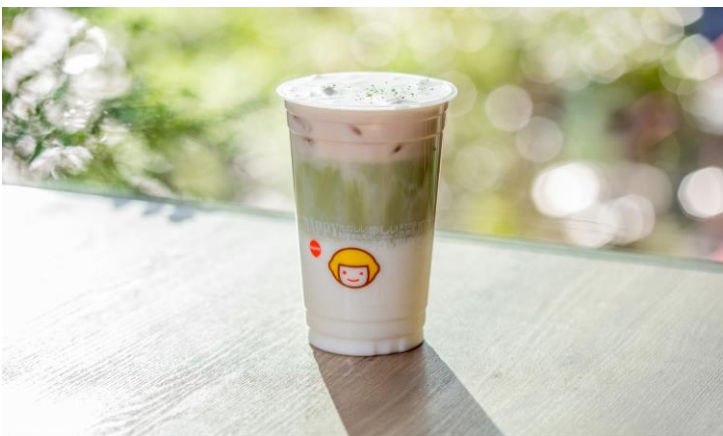
HAPPY LEMON 「桜ソルティチーズ宇治抹茶ラテ」