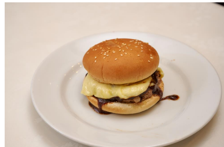
「とろけるチーズデミハンバーガー」