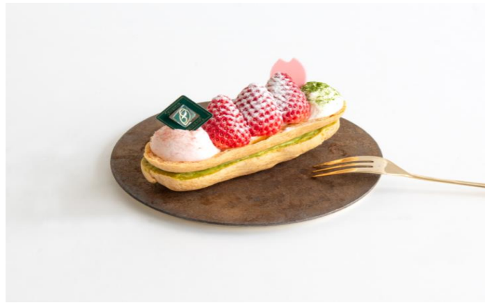
千疋屋総本店 メインストア 「苺と桜の抹茶エクレーシュー」