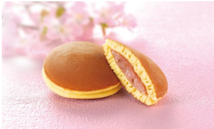
文明堂東京 「桜三笠山」