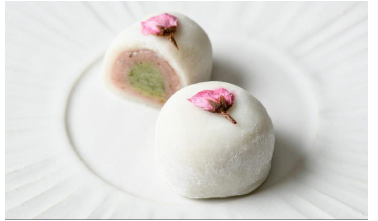
榮太樓總本舗 「さくら大福」