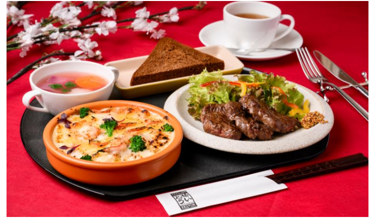
日本橋せいとう 「せいとう桜御膳」