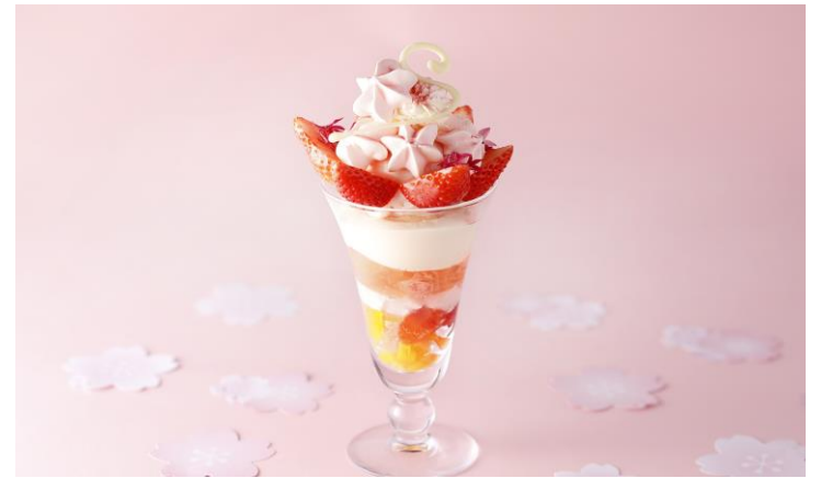
資生堂パーラー 「さくらパフェ-苺と春柑橘のクラウンスタイルー」