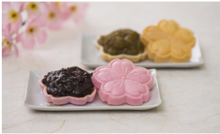
森八 「桜もなか(黒小倉あん、草小倉あん)」