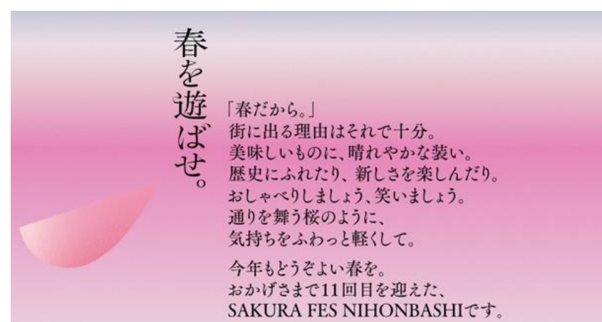
SAKURA FES NIHONBASHI 2024 ステートメント