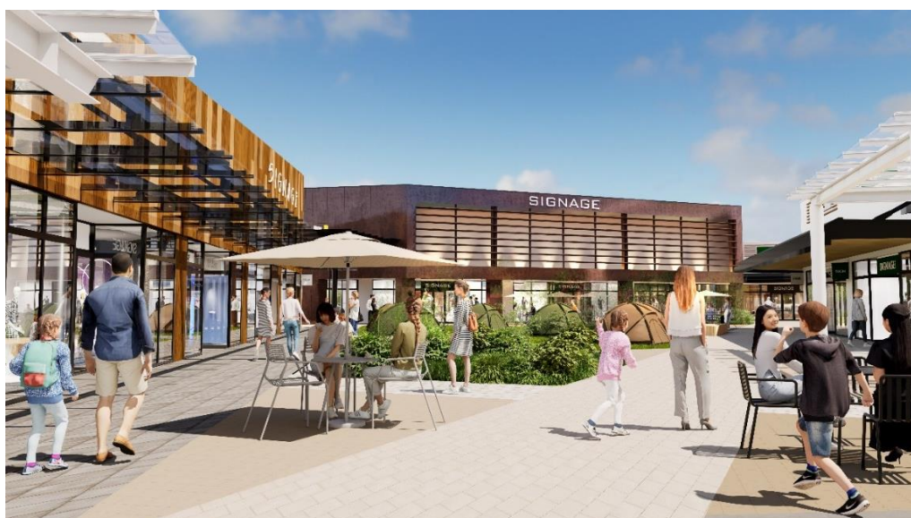
「三井アウトレットパーク 木更津 第4期開発計画」CG

当施設は東京湾アクアラインの「木更津金田 IC」に近接するアクセス良好な立地を強みとして、開業以来、千葉県内はもとより東京湾対岸の東京・横浜を含む関東圏全域から幅広い層のお客さまに多数ご来場いただいております。羽田空港からのアクセス性にも優れ、海外からのお客さまのご来場も増加しております。今回の第4期開発計画により、これまで以上に魅力的な施設を目指してまいります。また、CO2排出量の削減をはじめとしたESG課題の解決にも取り組んでまいります。