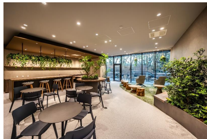
1F PARK LOUNGE(パークラウンジ)