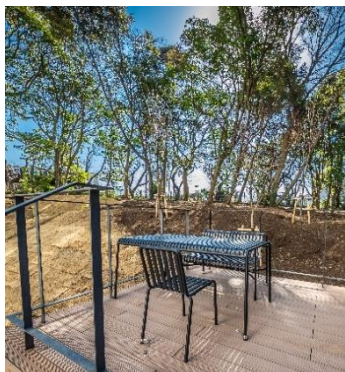
ピクニックテーブル