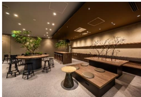
1F PARK LOUNGE(パークラウンジ)