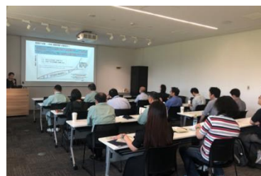
入居者向け講習会の様子(2023 年 7 月)

本サービスでは、「三井リンクラボ」が日本医師会認定産業医(労働衛生コンサルタント有資格者)を入居者へご紹介し、薬品を取り扱うなどラボで有害業務を行う“ライフサイエンス企業”ならではの義務(特殊健康診断・作業環境測