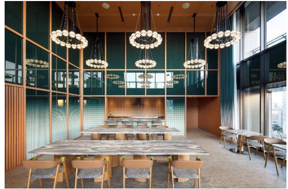
パーティールーム