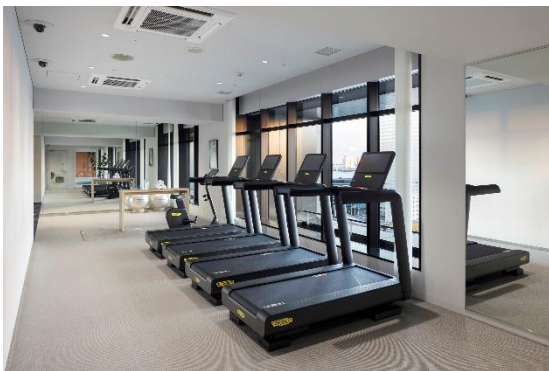
フィットネスルーム