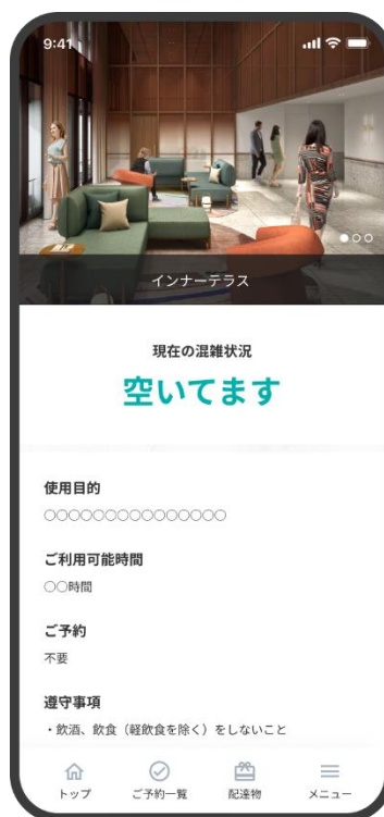
「スミカレジデンスアプリ」イメージ