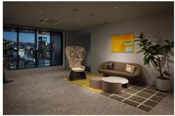
コミュニケーションラウンジ