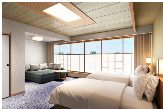
(仮)スーペリア客室 イメージ