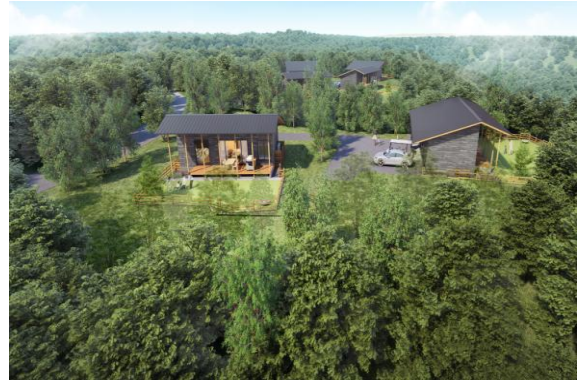
フォレストヴィラ 外観イメージ

既存ホテルの一部客室も改装を実施。3 階の和室 12 室は、NEMU RESORTらしい木の温もりと自然を感じるグリーンを基調としたデザインの「(仮)エグゼクティブ(46.8 ㎡)」に、2 階の和室 19 室は、ベッドを備えた「(仮)スーペリア(46.8 ㎡)」に、それぞれ生まれ変わります。