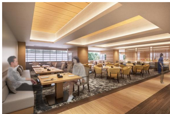
レストラン里海 内観イメージ