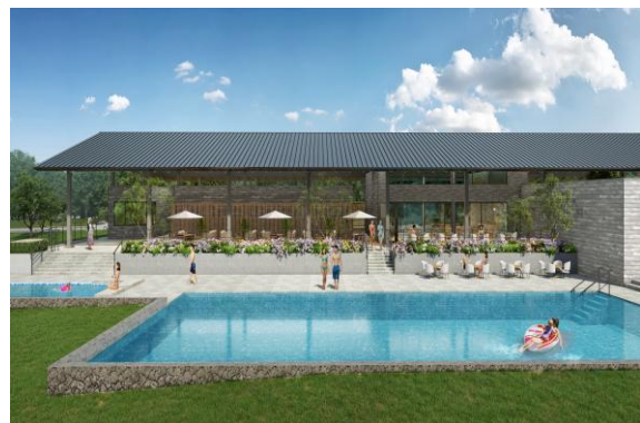
ヒルトップハウス メインプールイメージ