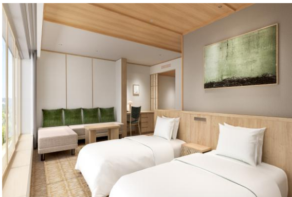
(仮)エグゼクティブ客室 イメージ

既存ホテルの一部客室も改装を実施。3 階の和室 12 室は、NEMU RESORTらしい木の温もりと自然を感じるグリーンを基調としたデザインの「(仮)エグゼクティブ(46.8 ㎡)」に、2 階の和室 19 室は、ベッドを備えた「(仮)スーペリア(46.8 ㎡)」に、それぞれ生まれ変わります。