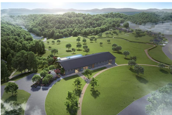
ヒルトップハウス 外観イメージ

NEMU RESORT 内の「てふてふの丘」に、英虞湾と「里山水生園」を一望できる「ヒルトップハウス」を新設いたします。プールやジェットバス、キッズプールを備え、テラスでは心身をリフレッシュするヨガ体験や様々なイベントの開催を予定しています。また「ヒルトップハウス」内には英虞湾を望む絶景の中で、団体パーティー等を行うことのできる「ダイニング里山」を新設いたします。