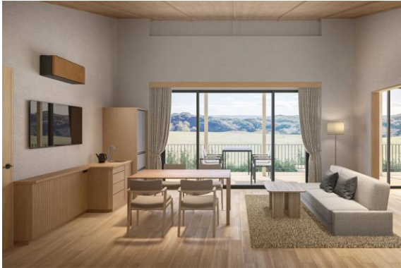
ヒルズヴィラ 室内イメージ

伊勢志摩の自然を最大限に体感できる客室として、81 ㎡(ウッドデッキ含む)のヒルズヴィラ 8 棟・フォレストヴィラ 10 棟を新設いたします。三重県産の木材を使用したヴィラでは、豊かな自然に包まれた、静かなひとときをお過ごしいただけます。各ヴィラにはビューバスやテラスを設け、テラスでは三重県産の食材をメインとしたバーベキューをお楽しみいただけます。新設するヴィラのうち 2 棟はファミリーやグループに最適な 2bedroom(118 ㎡)とし、既存のフォレストヴィラの 8 棟は全て愛犬と一緒にご宿泊いただける「with Dog」へと生まれ変わります。各棟へは乗用車の乗り入れもでき、各棟専用のランドカー(移動用カート)で、広大な NEMU RESORT の敷地内を快適にご移動いただけます。