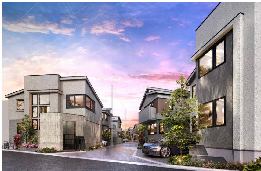
ファインコート世田谷桜上水ブリーズシティ 街並み完成予想 CG

今後のファインコートブランドにおいても「ウインドキャッチ窓」他快適な室内環境を目指し、再生可能エネルギーなどを活用した環境施策を積極的に推進することによって、三井不動産レジデンシャルの全住宅事業のブランドコンセプトである「Life-styling × 経年優化」のもと、多様化するライフスタイルに応える商品・サービスを提供するとともに、安全・安心で快適にらせる街づくりを推進し、持続可能な社会の実現・SDGs へ貢献してまいります。