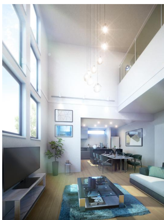
1 号棟「WONDER」リビングダイニング 完成予想 CG

全 21 棟の住棟は、それぞれのプラン特性によって、「WONDER」「SKY」「GREEN」といった 3 種類のカテゴリーに分類され、ライフスタイルや好みに応じて選択することが可能です。例えば、「WONDER」には、戸建てならではの 2 層吹抜けのリビング空間や広々ポーチの玄関、「SKY」には、明るい陽射しが入る「ソラバス」の導入や、洗面室やキッチンとつながる「ハウスキーピングバルコニー」の設置、「GREEN」には、一部住戸に坪庭を配置するなど、緑や光を取り込みやすい設計を実現し、ご家族が心身ともにリフレッシュできる住まいを目指します。