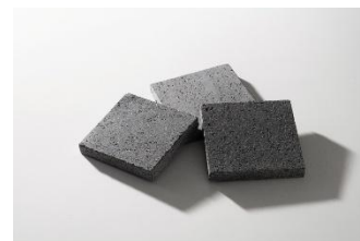
【鹿児島県産溶岩石】