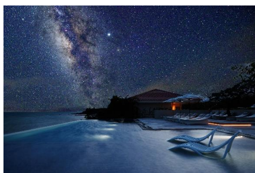
星空と「Quiet Pool」(冬季は温水化・通年利用可)