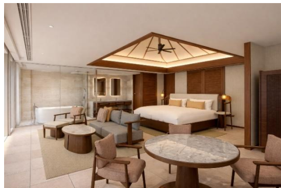
客室内装(イメージ)