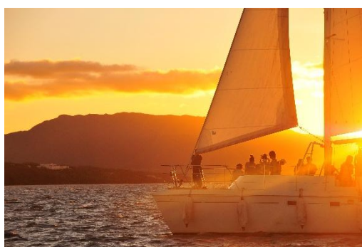
サンセットクルーズ