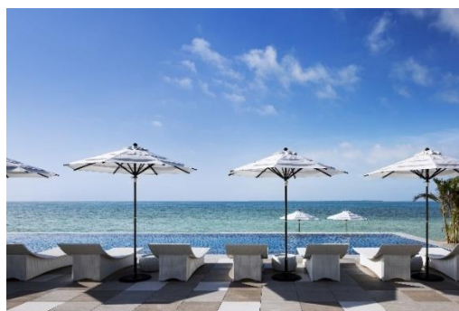
インフィニティプール「Main Pool」