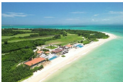
プール&ビーチエリア