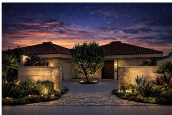
宿泊棟はいむるぶしヴィラ エントランス(イメージ)