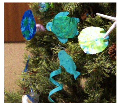
アップサイクルした館内装飾一例

さらに、島内で実施される地域のビーチクリーンやちゅらさん広場の清掃など、地域の環境活動に積極的に参加し、地域社会と連携したサステナブルな宿泊体験の提供に取り組んでいます。