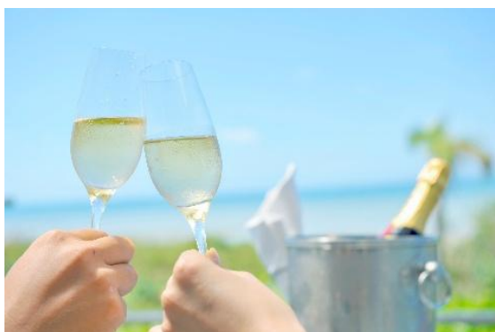
ウェルカムアメニティ(イメージ)