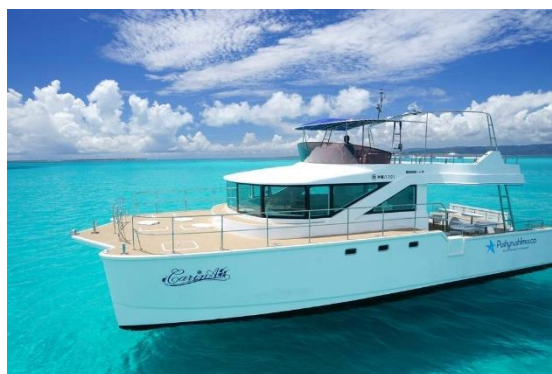
プライベートアクセス(イメージ・オプション)

※インルームダイニング、プライベートアクセスの詳細につきましては、別途はいむるぶしの公式ホームページにてご案内します。 (2026年6月上旬ごろ予定)