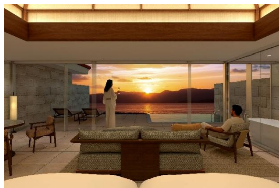
客室からの夕景(イメージ)