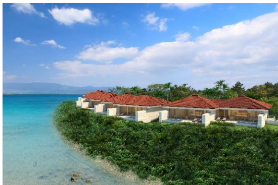
オーシャンフロント・プールヴィラ 鳥瞰(イメージ)

景色とともに流れる時間を味わう滞在中で、“何をしても幸せ、何もなくても幸せ”というはいむるぶしのコンセプトを体感いただける豊かなひとときをお過ごしいただけます。