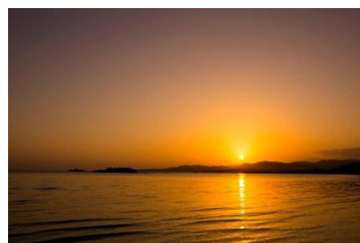
西表島に沈む夕陽

はいむるぶしでは、朝焼けの空から宵空、満天の星空まで一日の空の移り変わりや八重山諸島の雄大な自然を感じられる景色が広がっています。オーシャンフロント・プールヴィラの整備にあたり、世界自然遺産・西表島に沈むサンセットをはじめとした自然の魅力をより深く感じていただけるよう、景色を楽しめるスポットの整備やおすすめの過ごし方の提案を行ってまいります。少しずつ変わる空の色を眺めながら、風に揺れる葉の音や鳥のさえずりなどと共に、安らぎに満ちた時間をお過ごしください。