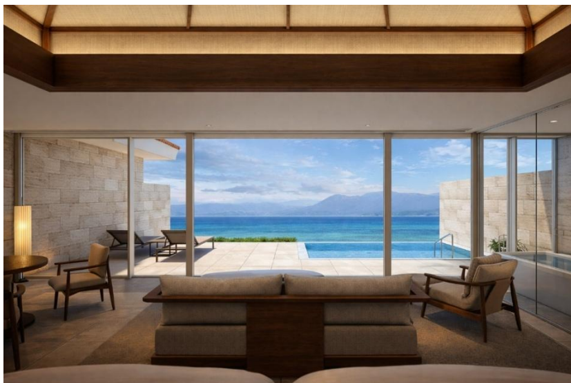
オーシャンフロント・プールヴィラ 客室から眺める西表島(イメージ)

美しい遠浅の海の先に西表島を望み、刻々と表情を変える空とともに夕陽が沈んでいく。八重山諸島の雄大な自然に身を委ねながら、ゆるやかに流れる時間の中で、深いリラクゼーションのひとときをご提供します。