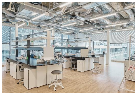
SS-F Lighthouse Lab 専有部