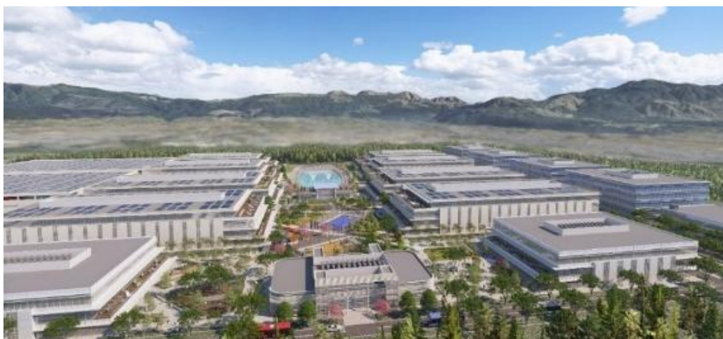
<イノベーション創発エリア イメージ>

今後見込まれるAI・半導体市場の成長を踏まえ、先端3nm半導体を視野に入れて、R&Dから量産まで幅広いエコシステムを構築し、持続的なイノベーションの創出を促進することにより、「新生シリコンアイランド九州」 ※1 の一翼を担うべく取り組んでまいります。