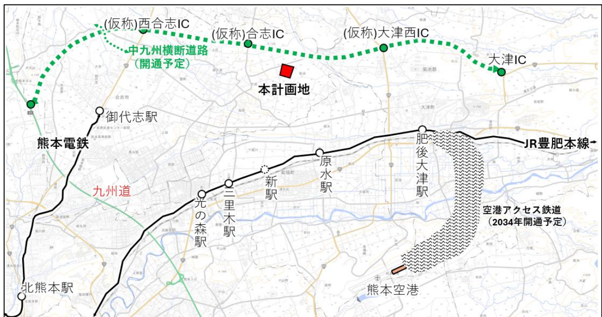
< 広域図 >

周辺県道の新設・拡幅とともに整備中の中九州横断道路(仮称)合志 IC より約 2km に位置し、また、阿蘇くまもと空港(本プロジェクト予定地より約 12km、当社が筆頭株主である熊本国際空港株式会社が運営)と豊肥本線を結ぶ空港アクセス鉄道(2034 年開通予定)も計画されるなど、広域交通アクセスに恵まれています。