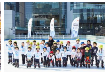
三井不動産スポーツアカデミー (アイススケートアカデミー)