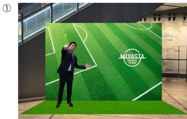
※最終確定前につき画像はイメージです