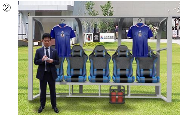
※最終確定前につき画像はイメージです