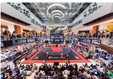
三井ショッピングパーク ららぽーと堺 (大阪府堺市)