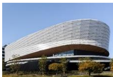
LaLa arena TOKYO-BAY (千葉県船橋市)

また、東京ドームなどで開催される大型アーティストライブと連動した公式 POP-UP イベントが行われる「MIYASHITA PARK」、本格的なスポーツ・エンターテインメントイベントが実施可能な屋内型スタジアムコート有する「三井ショッピングパーク ららぽーと堺」「三井ショッピングパーク ららぽーと安城」、スポーツや映画・音楽コンサートなどのパブリックビューイングが開催できるスポーツパーク有する「三井ショッピングパーク ららぽーと福岡」などのスポーツ・エンターテインメントの要素を盛り込んだ街づくりも手掛けています。