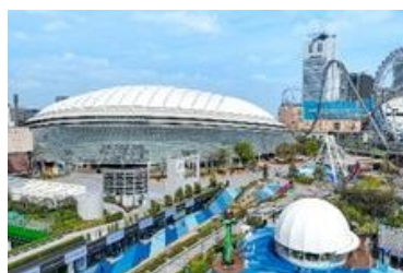
東京ドームシティ (東京都文京区)