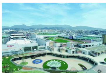
三井ショッピングパーク ららぽーと福岡 (福岡県福岡市)