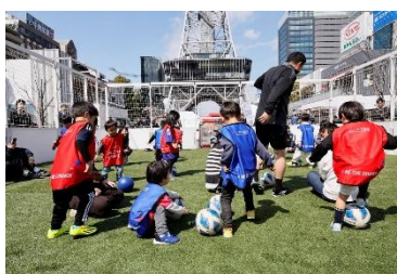
三井不動産フットボールスクエア (価値共創活動)