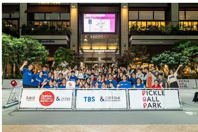
テナント企業向け参加型イベント「&BIZ event」 企業対抗ピククルボール大会「&BIZ CUP」開催の様子

三井のオフィスでは、&BIZを通じてワーカーの毎日をより豊かにし、テナント企業のパフォーマンスの最大化につながるサービス提供に取り組んでいます。