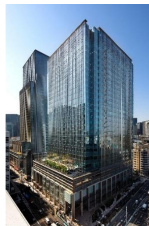
日本橋室町三井タワー