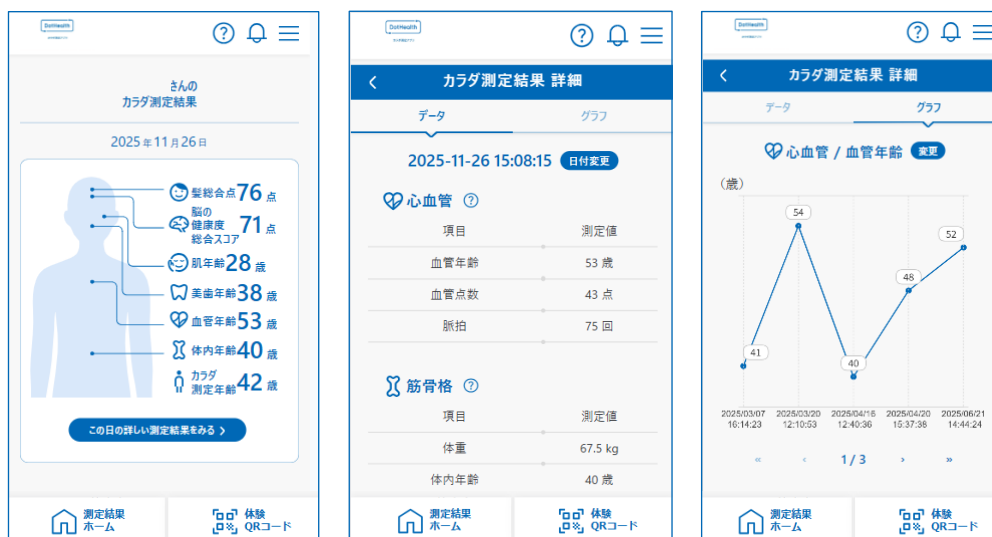
カラダ測定サービスに関するアプリケーションのイメージ

本サービスにおいては、継続的な利用によりユーザーの健康に関する意識変容・行動変容へつなげるとともに、日常生活における持続的な健康支援を実現します。オフィスワーカーが昼休みや業務の合間に利用し、日々の体調変化の把握や、結果の共有を通じた健康意識の醸成など、日常の中で継続的に活用されることを想定しています。また、コンディション管理を通じて生産性向上に資する活用も期待されます。