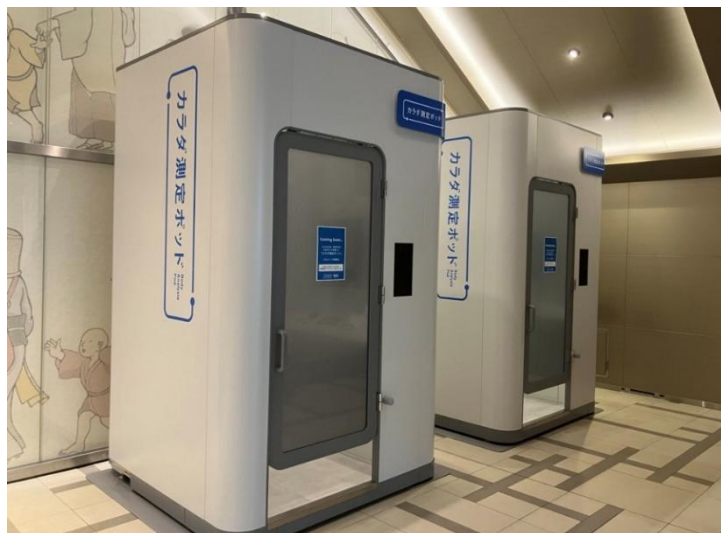
「カラダ測定ポッド」設置の様子(日本橋室町三井タワーB1階)

企業における健康経営や人的資本への関心の高まりを背景に、従業員のウェルビーイング向上に資する取り組みの重要性が増している中、今回の設置は、日本橋室町三井タワーおよび周辺オフィスに勤務するオフィスワーカーを主な対象とし、日常の中で健康状態を可視化できる環境を提供し、新しい健康習慣の創出を目指すものです。三井不動産は、オフィスワーカー向けサービス「&BIZ(アンドビズ)」の一環として、テナント企業の従業員の健康増進やウェルビーイング向上に資する取り組みとして本サービスを展開します。なお、本サービスは来街者にもご利用いただける環境とすることで、街全体への波及と新たなヘルスケア体験の定着を目指してまいります。