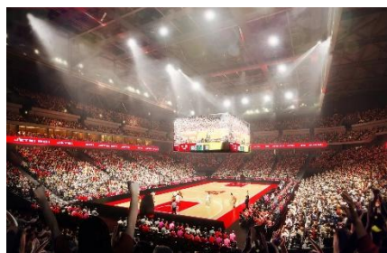
LaLa arena TOKYO-BAY (千葉県船橋市)