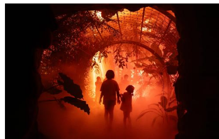
Light Cycles Kyoto (京都府左京区)