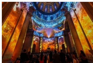
AURA Invalides (フランス・パリ) Moment Factory, 2023