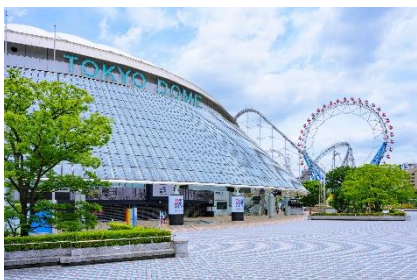
東京ドームシティ (東京都文京区)

今後、多様な場とコンテンツを掛け合わせ、エンターテインメントの力を活かした街づくりを推進してまいります。