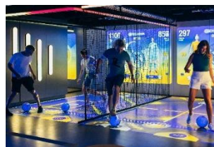
Real Madrid Games (スペイン・マドリド) Moment Factory, 2025