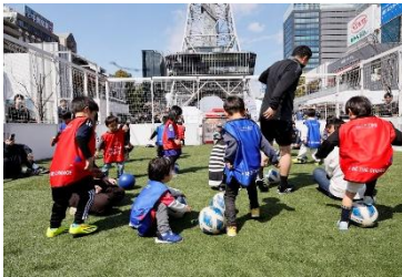
三井不動産フットボールスクエア (価値共創活動)