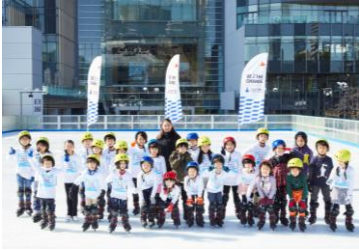
三井不動産スポーツアカデミー (アイススケートアカデミー)