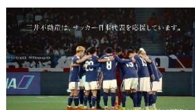
(広瀬さん NA) 三井不動産