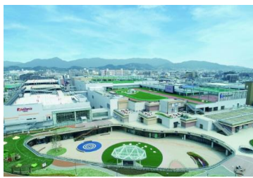
三井ショッピングパークららぽーと福岡 (福岡県福岡市)