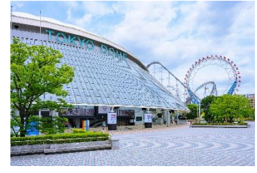
東京ドームシティ (東京都文京区)