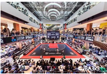
三井ショッピングパークららぽーと堺 (大阪府堺市)

また、東京ドームなどで開催される大型アーティストライブと連動した公式 POP-UP イベントが行われる「MIYASHITA PARK」、本格的なスポーツ・エンターテインメントイベントが実施可能な屋内型スタジアムコートを有する「三井ショッピングパークららぽーと堺」「三井ショッピングパークららぽーと安城」、スポーツや映画・音楽コンサートなどのパブリックビューイングが開催できるスポーツパークを有する「三井ショッピングパークららぽーと福岡」などのスポーツ・エンターテインメントの要素を盛り込んだ街づくりも手掛けています。