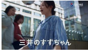
三井のすずちゃん