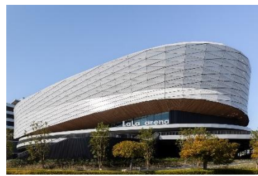
LaLa arena TOKYO-BAY (千葉県船橋市)