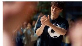
(広瀬さん NA) さあ、街から 未来をかえよう