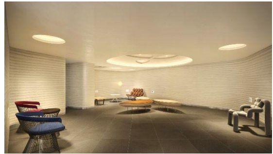
エントランスホール 完成イメージ