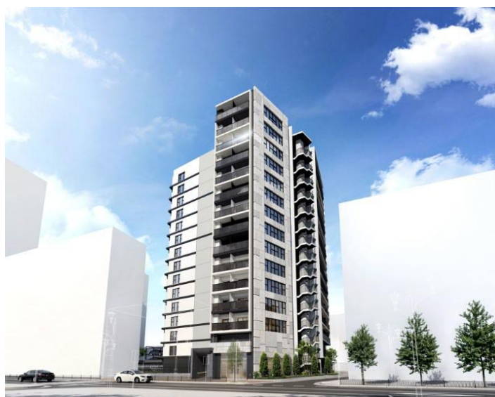
パークホームズ船橋 外観完成イメージ

今後も、三井不動産レジデンシャルの全住宅事業のブランドコンセプトである「Life-styling × 経年優化」のもと、多様化するライフスタイルに応える商品・サービスを提供するとともに、安全・安心で快適にくらせる街づくりを推進し、持続可能な社会の実現・SDGsへ貢献してまいります。