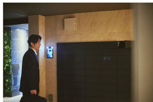
共用部顔認証イメージ(宅配ボックス)