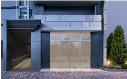
エントランス 完成イメージ

本物件は、JR 中央・総武線「船橋」駅徒歩 4 分、京成本線「京成船橋」駅徒歩 2 分に位置し、住みたい街ランキング千葉県で 1 位※ 1 、先進と趣きが重なり合う、千葉県有数の商業集積地である「船橋」の中心地に誕生します。徒歩 5 分圏内に便利な生活環境が広がる「船橋」駅は、「東京」駅まで 26 分、「新橋」駅まで 30 分、「品川」駅まで 35 分と、都内主要エリアにいずれも乗り換えなくアクセス可能です。三井不動産グループによる開発が進む「南船橋」エリアへもバスや自転車で快適にアクセス可能となります。