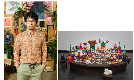
岡山県立美術館「瀬戸芸美術館連携プロジェクト平子雄一展 ORIGIN」2025年 展示風景