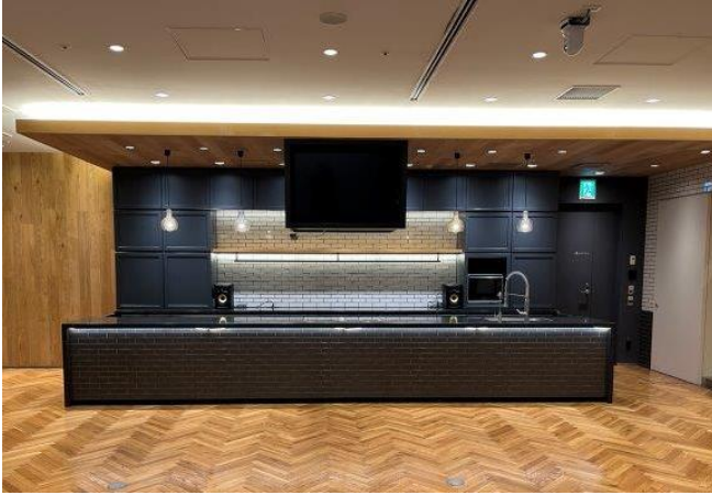
キッチンスペース

VIP 対応や商談、登壇者控室として利用可能な少人数向けの個室エリアを新たに整備します。イベント主催者は、メディア対応や個別プレゼンテーションなど、目的に応じた丁寧なコミュニケーション設計が可能になります。また、従来から備えていたキッチンスペースやテラスも、イベント会場として利用可能です。「食」を取り入れた体験型企画の展開や屋内外の一体利用による招待客向けレセプションなど、参加者同士の交流や印象に残る体験を生み出します。