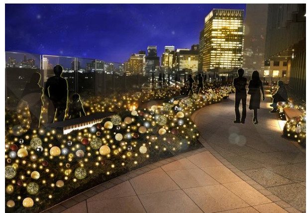
「PARK VIEW WINTER GARDEN」イメージ

※本リリースの内容は予告なく変更・中止になる場合がございます。予めご了承ください。