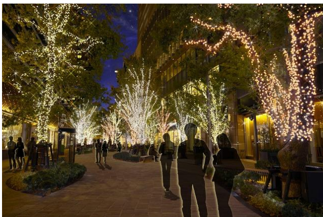
「HIBIYA Area Illumination」イメージ