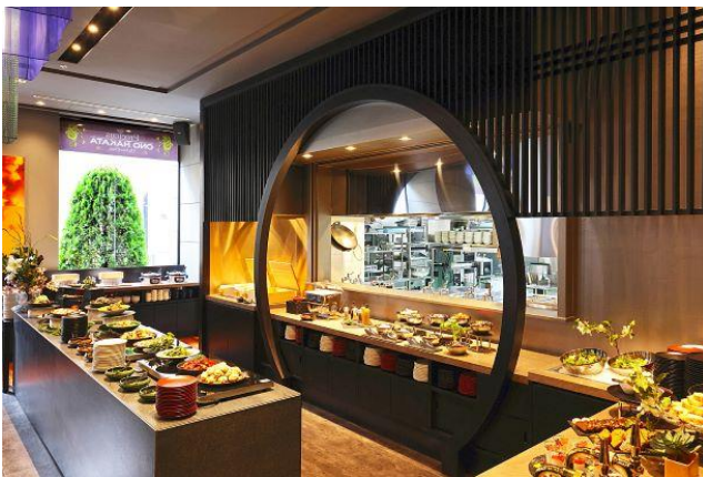
三井ガーデンホテル福岡中洲 「小野の離れ 博多本店」朝食